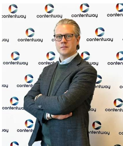
De Zweedse directeur

Dit was een win-winsituatie. We maakten tijdens de studiereis van de vierdes in Amsterdam gebruik van de gelegenheid om onze Erasmus+ stagiaires Se-n-Se GV te gaan bezoeken in Amsterdam. We werden overal met open armen ontvangen, ze maakten tijd voor ons en prezen onze toewijding naar de leerlingen toe.