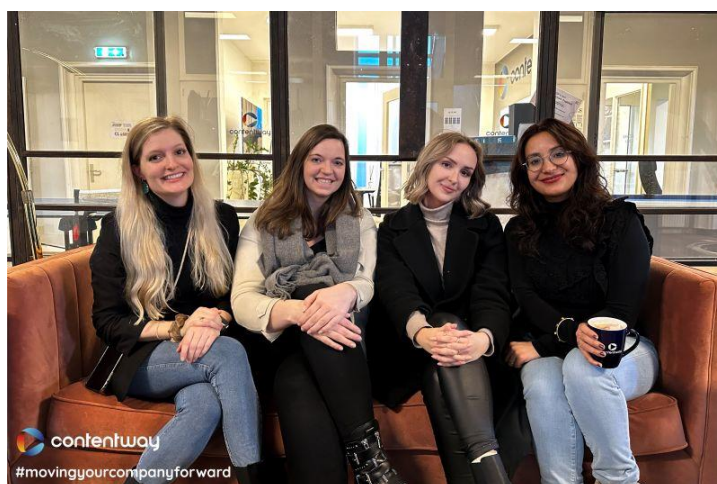
Aandacht voor balance work life