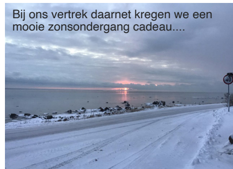
Bij ons vertrek daarnet kregen we een mooie zonsopgang cadeau....